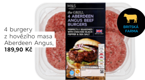
4 burgery z hovězího masa Aberdeen Angus, 189,90 Kč