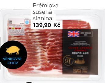
Prémiová sušená slanina, 139,90 Kč