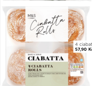
4 ciabatty, 57,90 Kč