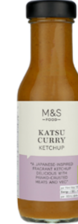
Kečup katsu curry v japonském stylu, 74,90 Kč