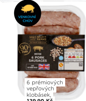
6 prémiových vepřových klobásek, 139,90 Kč