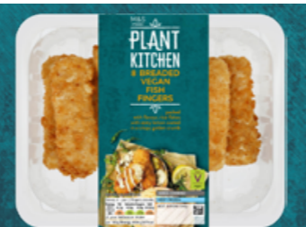
Veganské rybí prsty z řady Plant Kitchen, 159,90 Kč