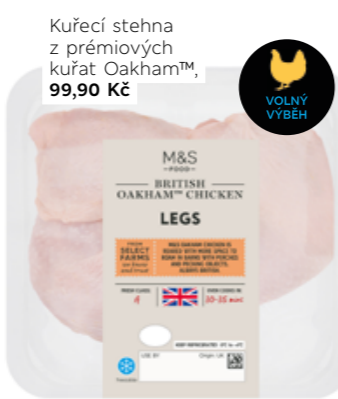
Kuřecí stehna z prémiových kuřat Oakham™, 99,90 Kč