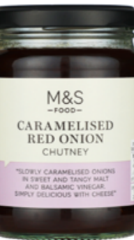
Chutney ze zkaramelizované červené cibule, 84,90 Kč