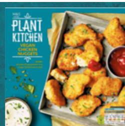
Veganské kuřecí stripsy z řady Plant Kitchen, 129,90 Kč