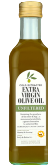
Extra panenský nefiltrovaný olivový olej, 179,90 Kč

JAK VÍ KAŽDÝ ŠÉFKUCHAR, tajemstvím pokrmu je omáčka, která jej drží pohromadě. Krásně spojí všechny textury a chutě.