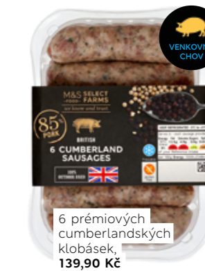
6 prémiových cumberlandských klobásek, 139,90 Kč