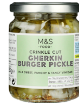
Okurky nakrájené na plátky v sladkém octovém nálevu, 61,90 Kč