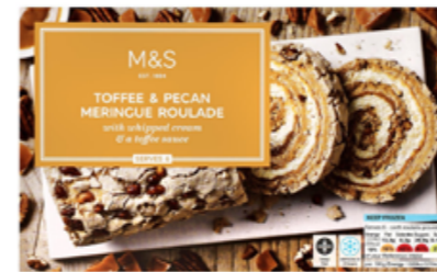
Roláda s karamellem a pekanovými ořechy, 199,90 Kč