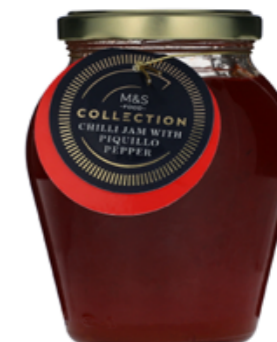
Chilli džem s papričkami piquillo, 74,90 Kč