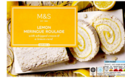
Roláda s citrónovým krémem, 199,90 Kč