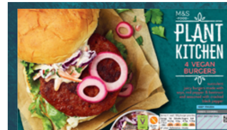
4 veganské burgery z řady Plant Kitchen, 159,90 Kč

Grilování není žádnou výjimkou, právě naopak! Dejte svým hostům na výběr z několika omáček a dipů a každý bude večeri vychvalovat. Nezapomeňte na nakládanou zeleninu pro extra svěží kyselkavou křupavost. S okurkami a cibulkami nešlápnete vedle.