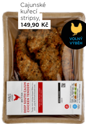
Cajunské kuřecí stripsy, 149,90 Kč