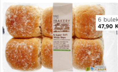
6 bulek, 47,90 Kč