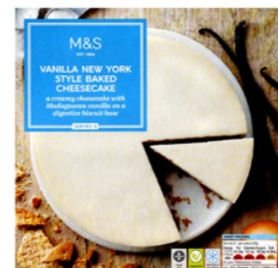
Newyorský cheesecake s madagaskarskou vanilkou, 129,90 Kč

Protože jsou všechny tyto čerstvé dobroty při zakoupení zmrazeny, můžete si naplánovat nákup kdykoliv během týdne podle toho, kdy máte čas, a potřebné pak jen rozmrazit v lednici nebo dopéct v troubě v den servírování. Extra klobásky a cheesecake v mrazáku vás také zachrání, až se vám zachce spontánního táboráku s dobrým jídlem.