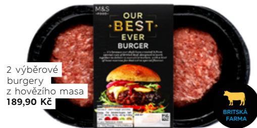
2 výběrové burgery z hovězího masa, 189,90 Kč