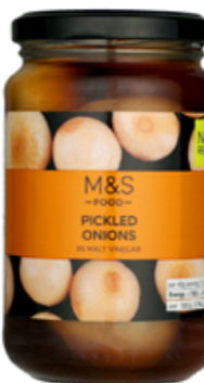
Nakládané cibulky ve sladovém octu, 69,90 Kč