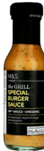
Omáčka na burgery s nakládanými okurkami a koprovým olejem, 84,90 Kč