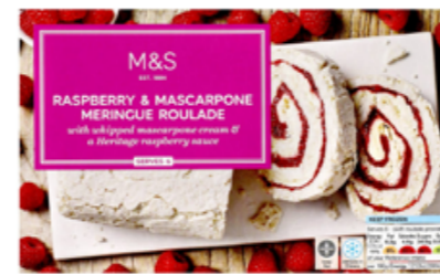
Roláda s malinami a mascarpone, 199,90 Kč