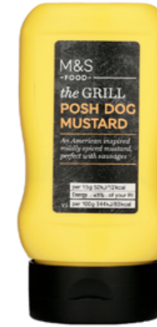
Hořčice na hot dogy v americkém stylu, 64,90 Kč